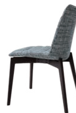
B10 (1) DB: 38-6177