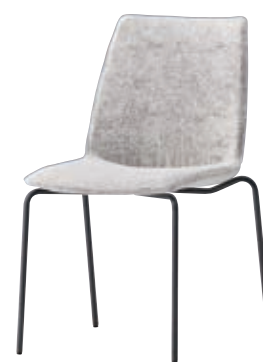
A10 (2) GP: 48-6009