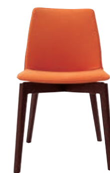
B10 (2) BW/ラムース