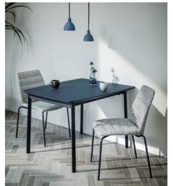
1015: FBU A10 (1) GP×2: 38-2350