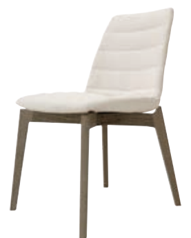
B10 (1) GY: 18-6209