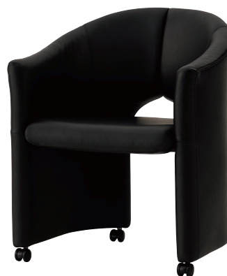
01 W : L-1605